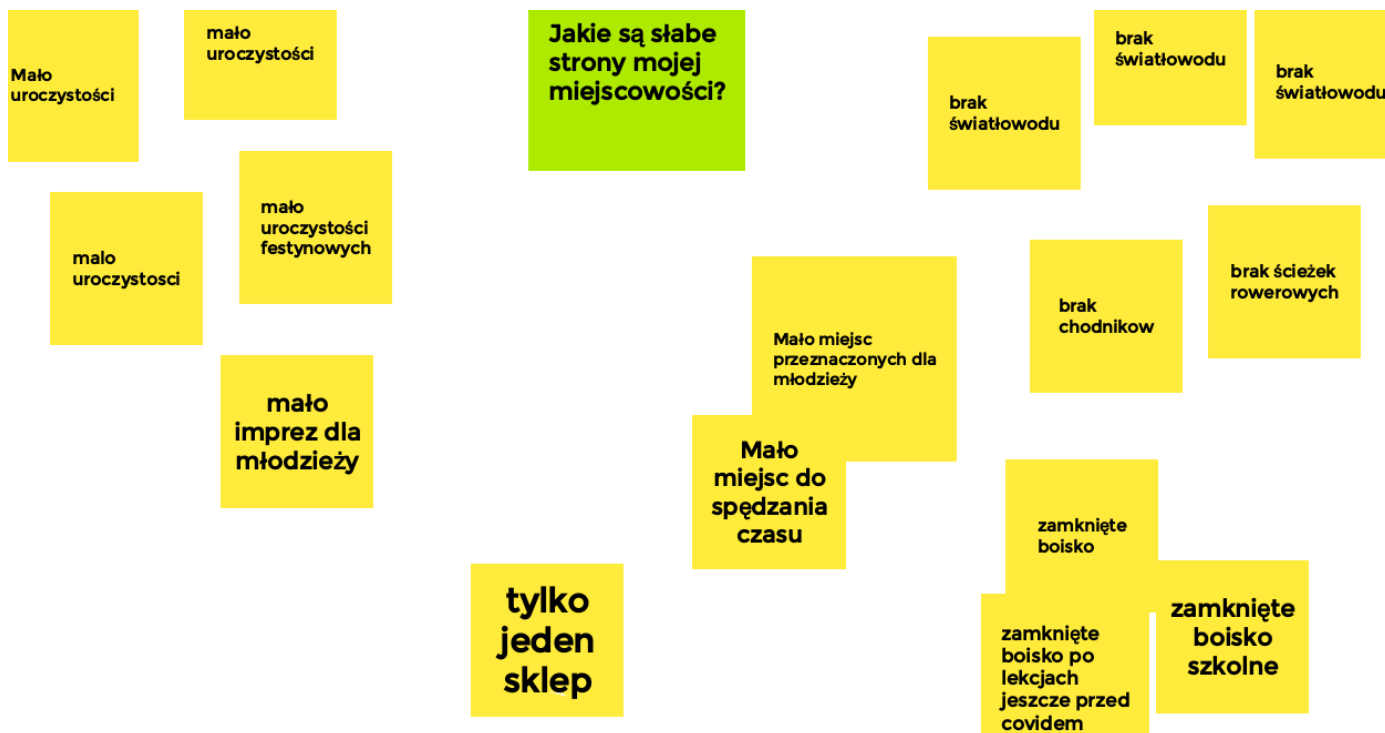
Ryc. 11. Słabe strony Wary wskazane przez młodzież

Młodzi mieszkańcy Wary wskazali również słabe strony swojej miejscowości. Najczęściej pojawiały się braki infrastrukturalne (brak chodników i ścieżek rowerowych). Mimo obecności światłowodu we wsi, młodzi mieszkańcy o nim nie wiedzą lub nie umieją się do niego podłączyć. Często pojawiały się także informacje o niewystarczającej liczbie organizowanych festynów i imprez dla młodzieży.