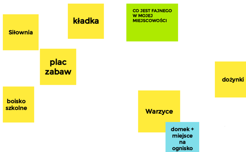
Ryc. 10. Mocne strony Wary wskazane przez młodzież

Uczniowie ze szkoły w Warze wśród atutów swojej miejscowości zdecydowanie wymieniali konkretne miejsca – boiska, plac zabaw, siłownię, miejsce na ognisko czy kładkę. Cenione są więc miejsca, w których młodzież może spędzać wspólnie czas. Wśród mocnych stron zostały również wskazane dożynki.