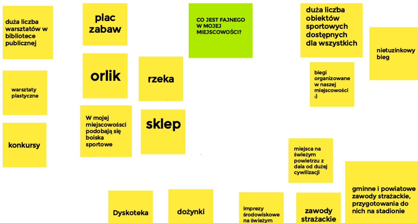
Ryc. 6. Mocne strony Hłudna wskazane przez młodzież

Natomiast najsłabszymi stronami Hłudna w oczach młodych mieszkańców jest brak miejsc, w których można się spotykać, brak ścieżek rowerowych i chodników. Uczniowie podawali także bardzo ogólne sformułowania takie jak „brak rozrywki” czy „mało imprez”, nie precyzując jakie wydarzenia mają na myśli.