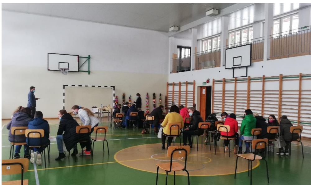
Ryc. 16. Mieszkańcy gminy podczas warsztatów badawczych

Podczas każdej rozmowy z mieszkańcami gminy okazywało się, że potrafią wymienić przynajmniej kilka osób, które w amatorski sposób zajmują się wyrobami rękodzielniczymi. W gminie mieszkają osoby, które zajmują się pisaniem ikon, wyplataniem przedmiotów z wikliny.