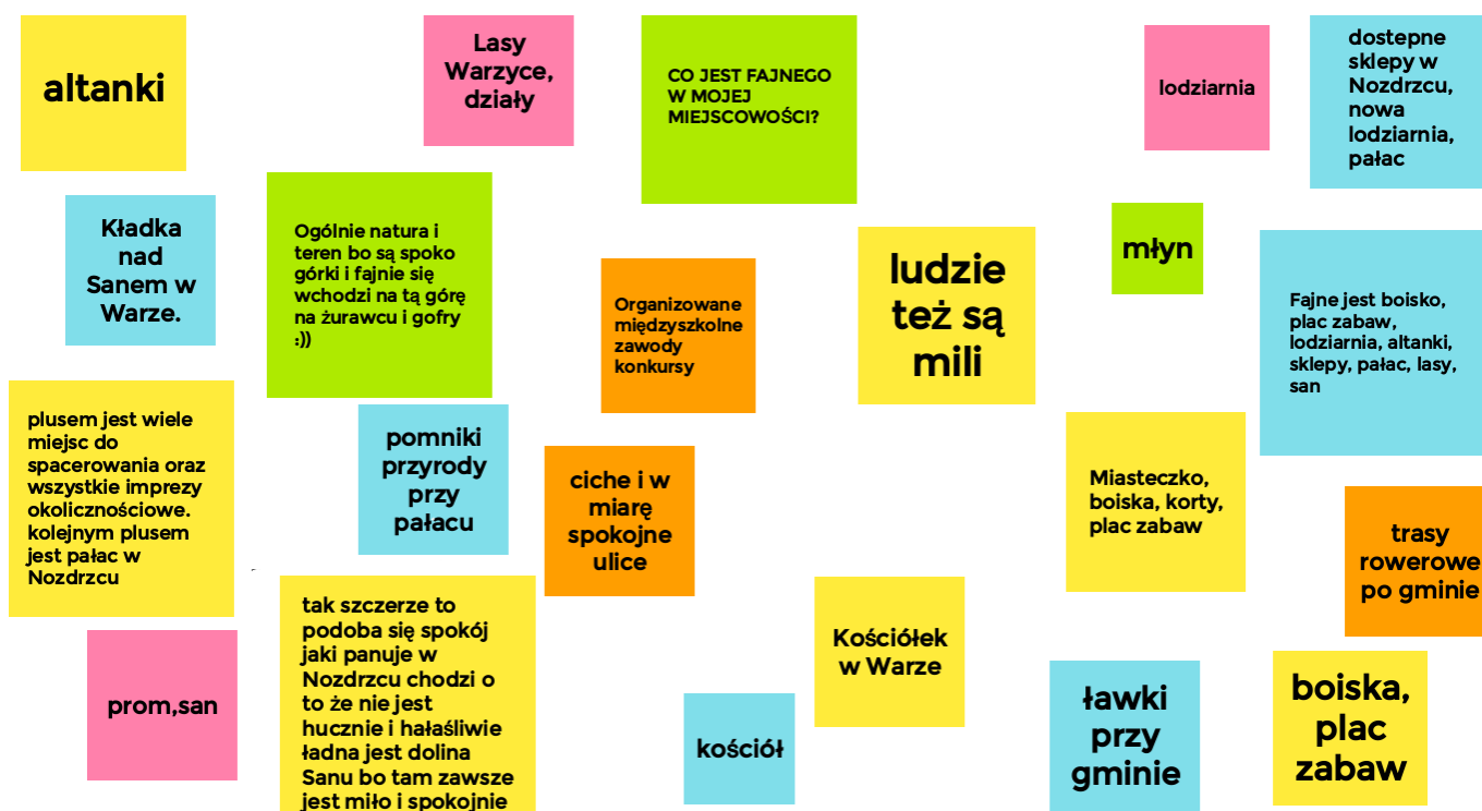
Ryc. 8. Mocne strony Nozdrzca wskazane przez młodzież

Uczniowie ze szkoły podstawowej w Nozdrzcu dostrzegają dużo zalet swojej miejscowości. Mocną stroną jest obecność obiektów sportowych i różnorodność miejsc do spacerowania. Chwalą sobie także spokój panujący w miejscowości.