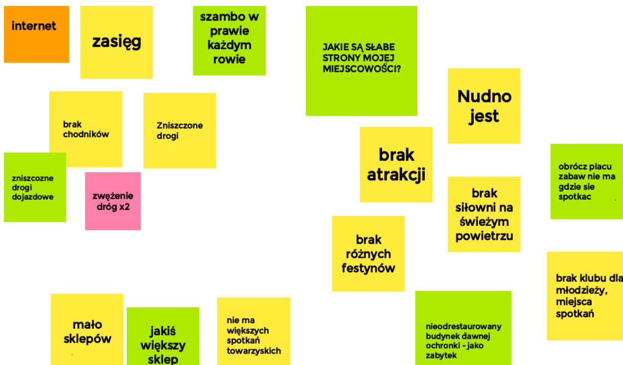
Ryc. 13. Słabe strony Wesołej wskazane przez młodzież

Nie zabrakło również słabych stron, wśród których najczęściej pojawiały się problemy infrastrukturalne (brak chodników, problemy z zasięgiem) oraz brak ogólnodostępnego miejsca spotkań.