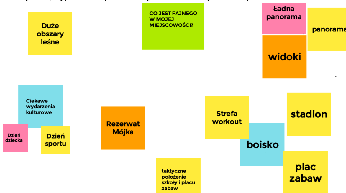
Ryc. 12. Mocne strony Wesołej wskazane przez młodzież

Uczniowie z Wesołej jako mocne strony swojej miejscowości wskazywali piękną panoramę, duże obszary leśne, wyposażenie sportowe miejscowości oraz wydarzenia sportowe.