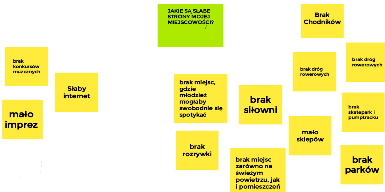
Ryc. 7. Słabe strony Hłudna wskazane przez młodzież

Natomiast najsłabszymi stronami Hłudna w oczach młodych mieszkańców jest brak miejsc, w których można się spotykać, brak ścieżek rowerowych i chodników. Uczniowie podawali także bardzo ogólne sformułowania takie jak „brak rozrywki” czy „mało imprez”, nie precyzując jakie wydarzenia mają na myśli.