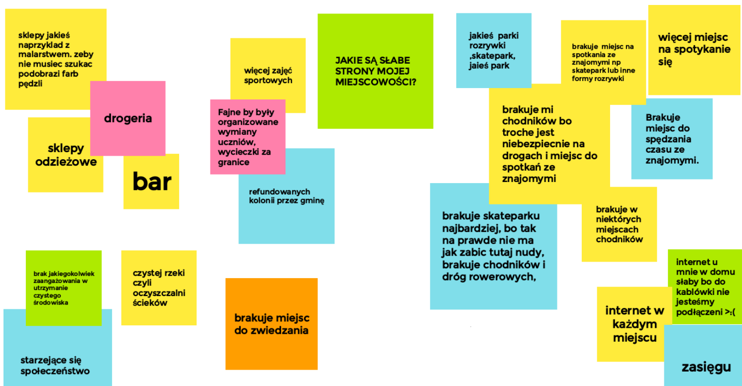
Ryc. 9. Słabe strony Nozdrzca wskazane przez młodzież