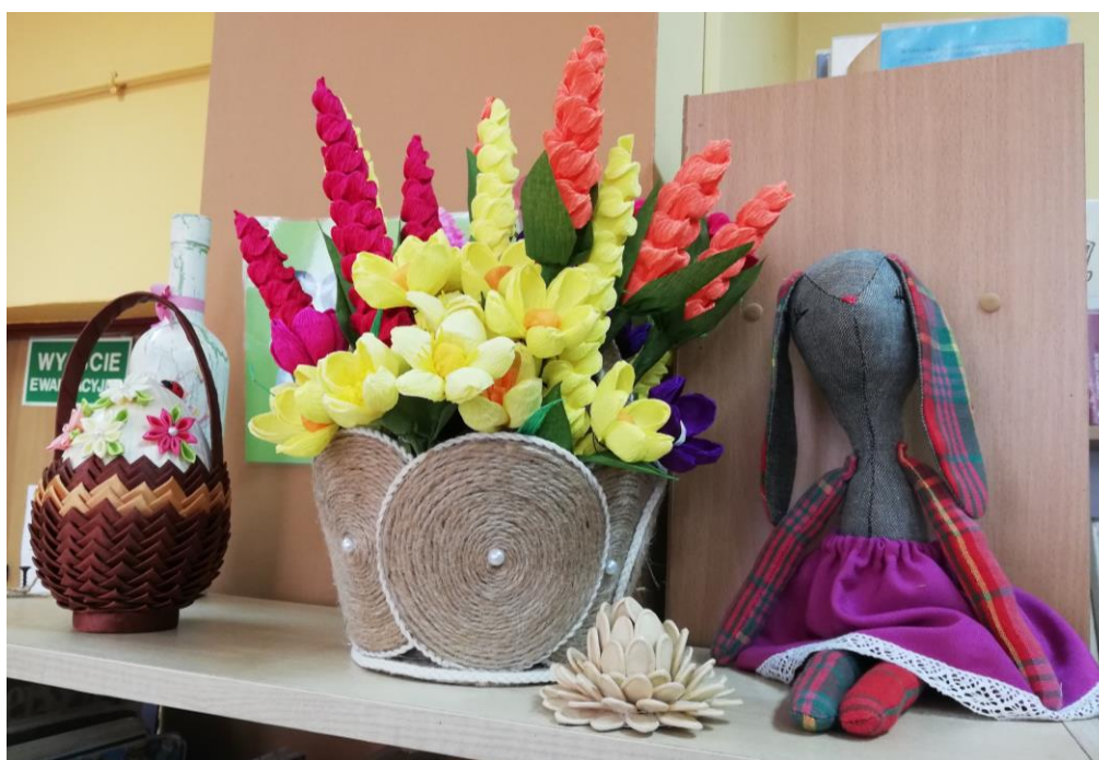
Ryc. 3. Rękodzieła powstałe podczas warsztatów w bibliotece w Hłudnie

Niektóre zajęcia prowadzone przez biblioteki mają charakter cykliczny (w wakacje, ferie zimowe), a niektóre okolicznościowe i są związane ze świętami lub szczególnymi dniami w roku (np. Dzień Babci i Dziadka, Dzień Matki). Zdarza się także, że biblioteka organizuje wydarzenie, którego pomysł zgłoszą mieszkańcy. Według bibliotekarek dzieci chętnie przychodzą do bibliotek gminnych, bo jest to miejsce mniej formalne niż biblioteka szkolna.