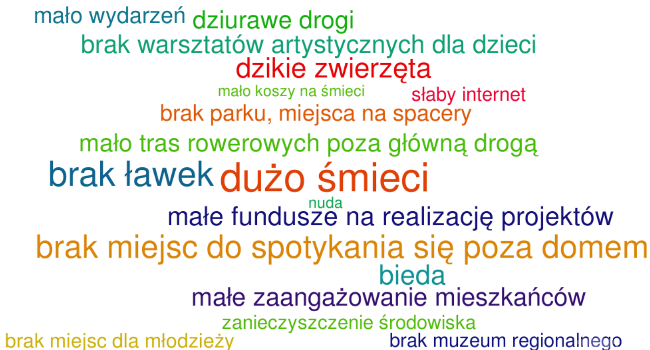
Ryc. 5. Negatywne rzeczy w gminie Nozdrzec – chmura skojarzeń utworzona z odpowiedzi mieszkańców.

Mimo minusów, mieszkańcy postrzegają swoją gminę jako miejsce z potencjałem, w którym dobrze się czują i lubią przebywać. Dostrzegają jej zalety i wady oraz potrafią wskazać czynniki, które motywują i pomagają przy podejmowaniu inicjatyw oraz bariery, które utrudniają realizację własnego pomysłu.