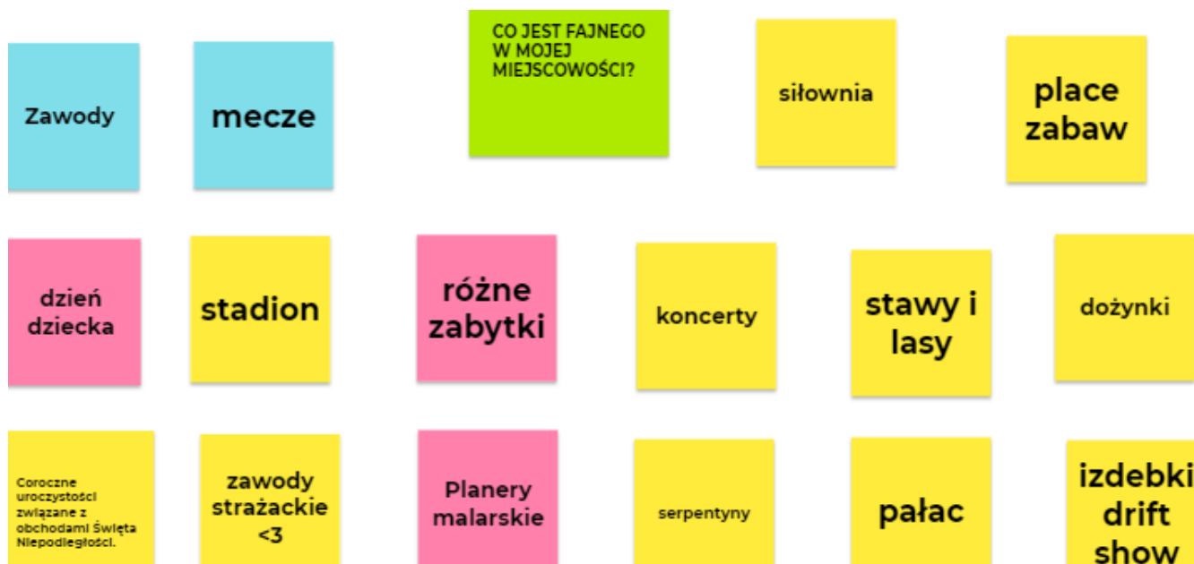
Ryc. 14. Mocne strony Izdebek wskazane przez młodzież

Uczniowie w Izdebkach jako zalety swojej miejscowości wymieniali konkretne obiekty (stadion, siłownia, place zabaw) i wydarzenia (zawody, koncerty, drifty, plenery malarskie).